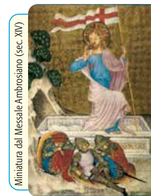
Miniatura dal Messale Ambrosiano (sec. XIV)

Via B. Crespi, 30 - 20159 Milano - Tel. 02.345608.1 - Fax 02.345608.36 - Distr. Libreria Ancora Via Larga, 7 - 20122 Milano - Tel. 02.5830.7006 - abbonamenti@ancoralibri.it LA MESSA FESTIVA DEI FEDELI - Settimanale liturgico - N. 20 - Anno 35 - Direttore Responsabile G. Zini - Trib. Milano n. 344 del 6-7-1985 - Prezzo € 0,041 - Stampato su carta riciclata. Imprimatur: in Curia Arch. Mediolani die 4-11-2019, B. Marinoni Vic. ep.