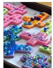
con pasta di sale e perline colorate

VUOI REALIZZARE IL TUO CROCIFISSO CON LA PASTA DI SALE?