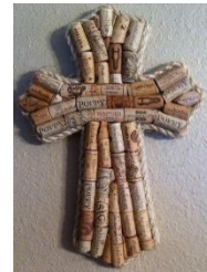
con tappi di sughero