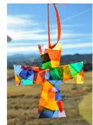
con carta velina colorata