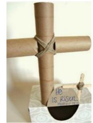
con rotoli carta igienica