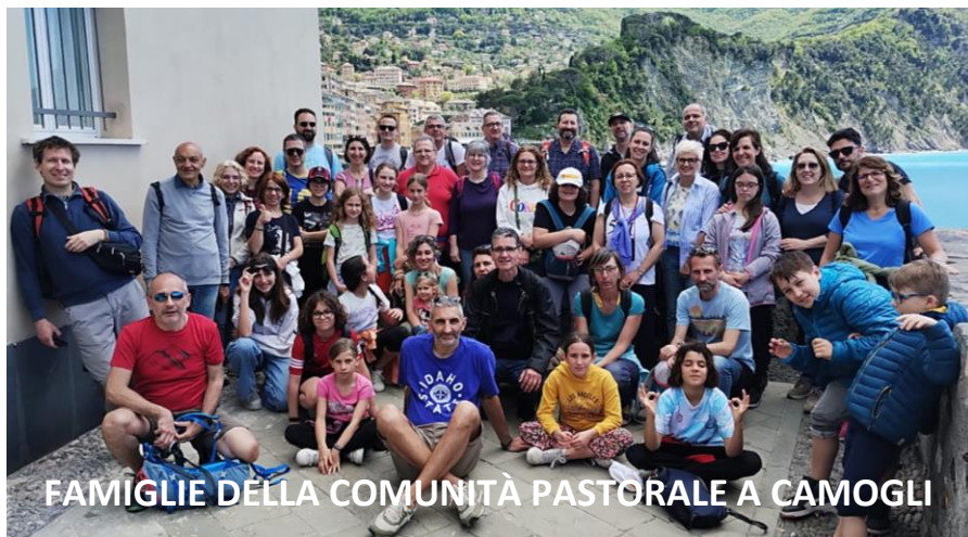
FAMIGLIE DELLA COMUNITÀ PASTORALE A CAMOGLI

Che cosa significa riconoscersi così? Significa che c'è sempre qualcuno che mi attende e che anch'io posso voler veramente bene a tutti, senza la preoccupazione di essere